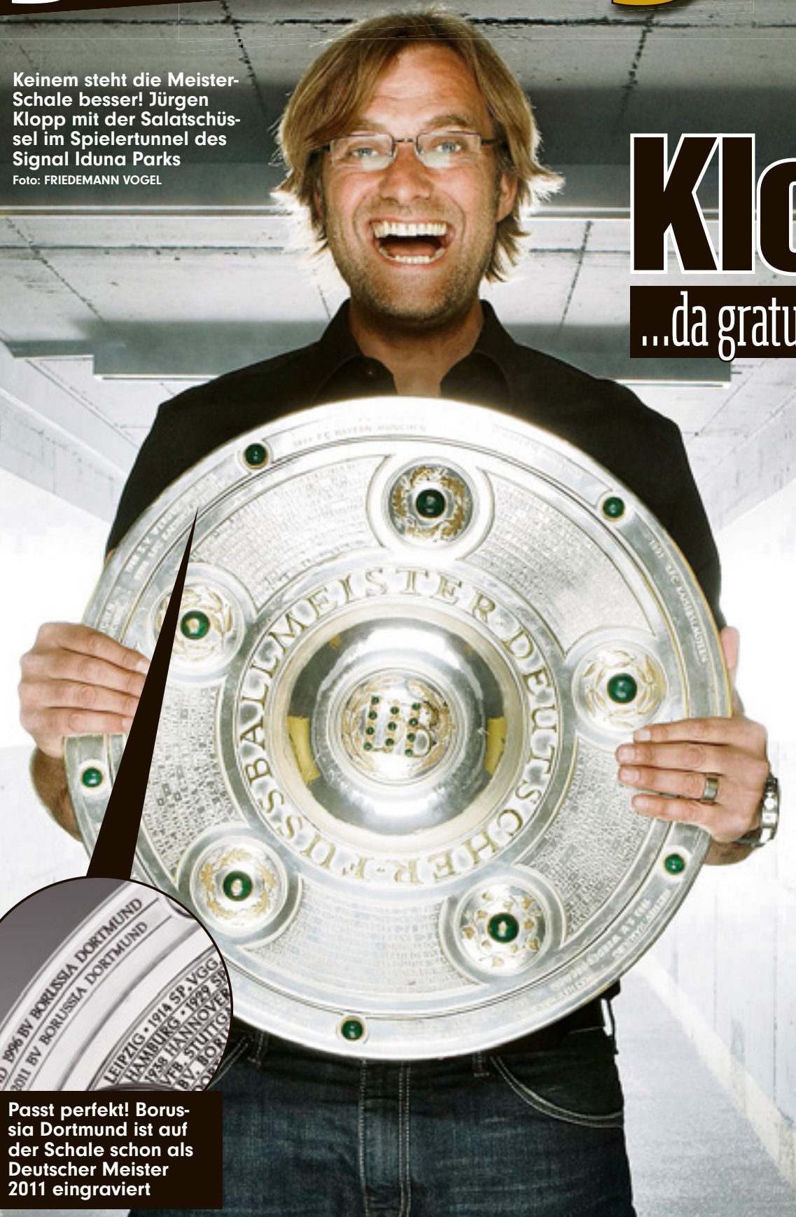
Keinem steht die Meister-Schale besser! Jürgen Klopp mit der Salatschüssel im Spielertunnel des Signal Iduna Parks